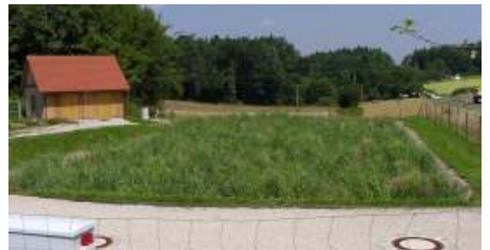
Eingebunden in das Landschaftsbild – Bodenfilter im August 2002