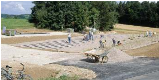
Ein hohes Maß an Eigenleistung senkt die Investitionskosten

Die Bürger im mittelfränkischen Waizenfeld in der Gemeinde Pommelsbrunn (Landkreis Nürnberger Land) haben sich im Jahr 2001 entschieden ihre Abwässer künftig über eine Pflanzenkläranlage zu reinigen.