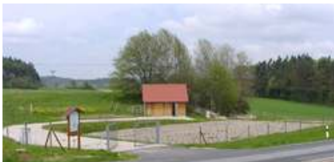
Vertikalfilter zu Beginn der Vegetationsperiode

Die Anforderungen werden nun mit einem kombinierten Klärsystem erfüllt. Ein Emscherbecken übernimmt die mechanische Vorreinigung des Abwassers. Das Herzstück ist eine 440 m 2 umfassende, vertikal durchströmte Pflanzenkläranlage mit nachfolgendem Horizontalfilter. Die Reinigungsleistung liegt bei den relevanten Parametern bei über 95 Prozent, so dass das gereinigte Abwasser trotz Karstgebiet problemlos über eine bewachsene Mulde versickert werden kann.