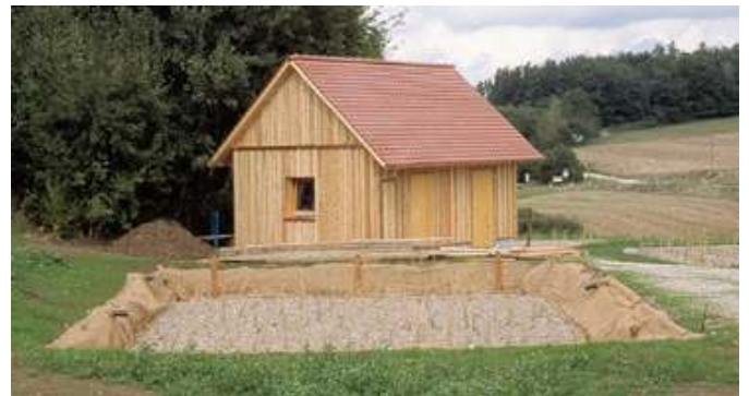
Klärschlammvererdungsanlage kurz vor Inbetriebnahme

Der anfallende Klärschlamm verbleibt ebenfalls im Ort. In einem mit Schilf bepflanzen Vererdungsbeet wird er auf natürliche Weise getrocknet. Das entstehende Sickerwasser wird der Kläranlage zugeführt.