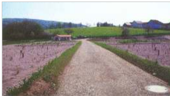
Vertikalfilter zu Beginn der Vegetationszeit

Um den Mischwasserzufluß auf 5 l/s (18 m 3 /h) zu beschränken ist der Kläranlage ein Regenüberlaufbecken vorgeschaltet. Auf der Kläranlage wird das Abwasser in einem Spiralsieb und in den zwei unterirdisch eingebauten Emscherbecken mechanisch vorgeklärt. Der Schlamm verbleibt in der Trichterspitze der Becken und wird einmal im Jahr abgefahren. Die biologische Reinigung erfolgt in dem mit Schilf bepflanzen Bodenfilter. Das Abwasser wird dazu über die gesamte Beetfläche verteilt und durchsickert diesen in vertikaler Richtung. Das gereinigte Abwasser wird über die Ablaufleitung der Haune zugeführt.