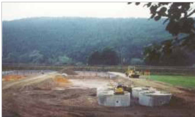
Bauzeit der Kläranlage: August bis Dezember 2001

Die Marktgemeinde Haunetal im nordhessischen Landkreis Hersfeld-Rotenburg entschied sich nach einer Funktionalauschreibung die Abwässer der Ortsteile Odensachsen und Meisenbach künftig über eine Pflanzenkläranlage zu reinigen. Ausschlaggebend waren sowohl die niedrigen Investitionskosten, als auch die zu erwartenden günstigen Betriebskosten.