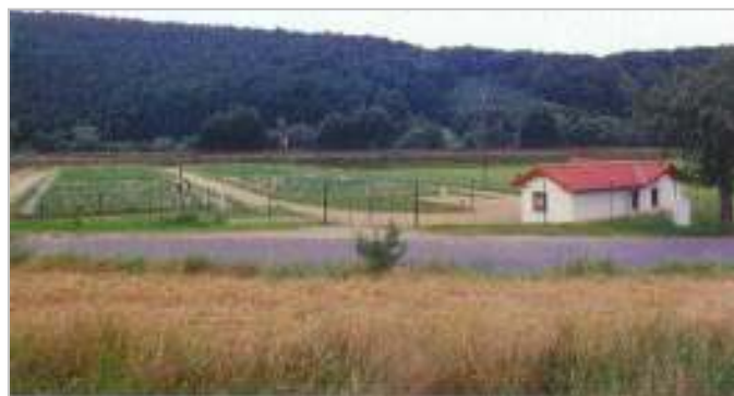
Eingebunden in das Landschaftsbild - Kläranlage im Juli 02